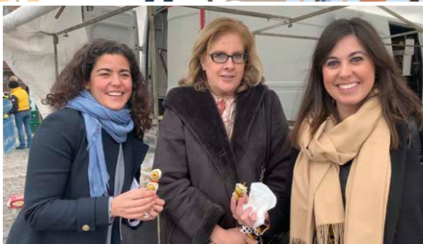
Las concejales de Desarrollo Económico, de Seguridad y de Medio Ambiente en el Mercadillo de Majadahonda.