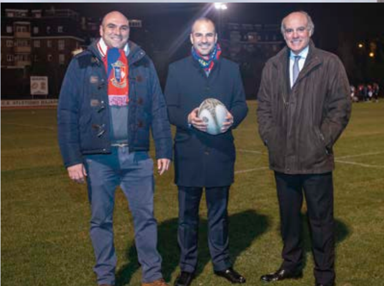
El alcalde, junto a los concejales de Deportes y Urbanismo, en uno de los primeros entrenamientos en la renovada instalación.