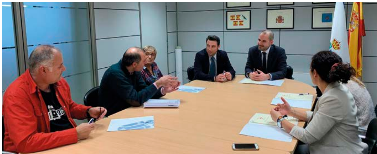
El alcalde y el Primer Teniente de Alcalde en el momento de la firma con los sindicatos.

El Gobierno municipal ha aprobado la incorporación de diez policías locales a la plantilla, tal y como viene recogido en el acuerdo para la oferta de empleo público firmado entre el alcalde y los sindicatos, UGT, CCOO, CSIF y CPPM, a finales del pasado mes de diciembre y que ya tiene luz verde por parte de la Junta de Gobierno.