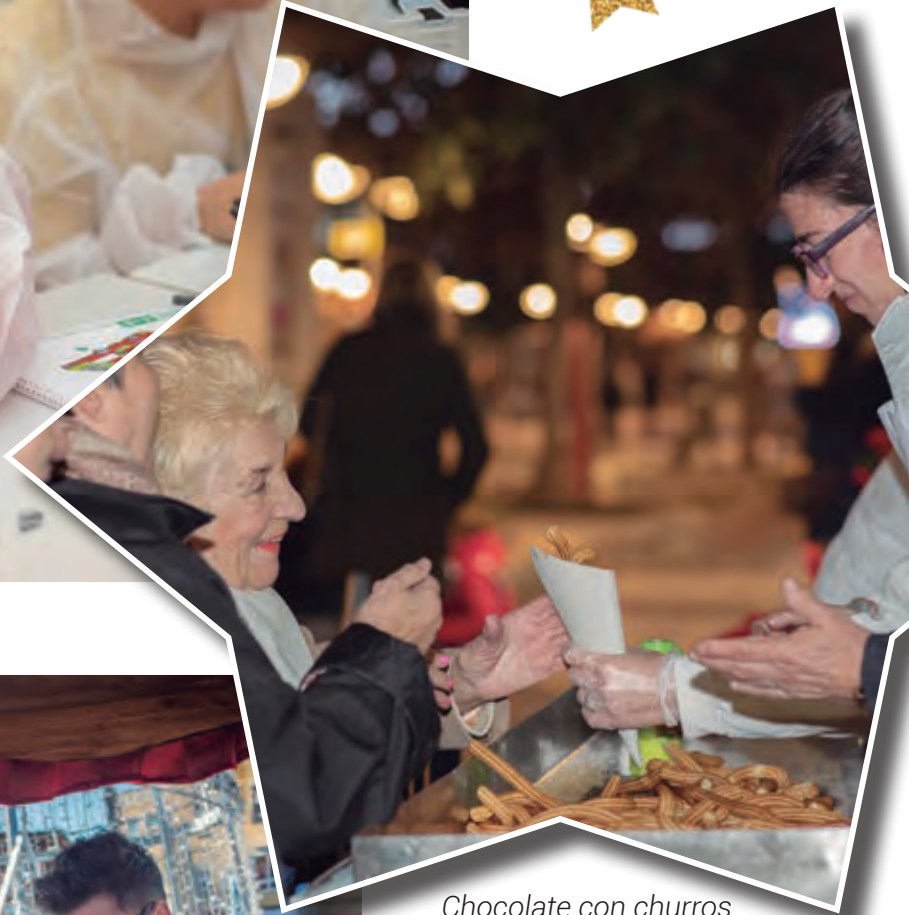
Chocolate con churros en la inauguración del Belén