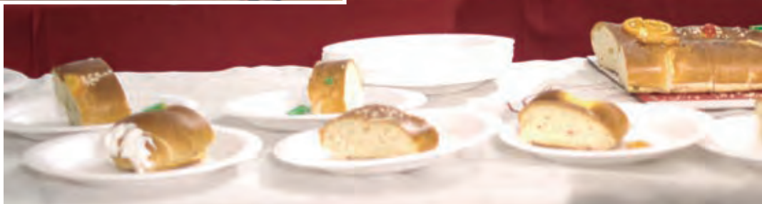
Gran rosconada infantil