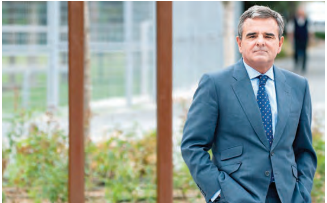
Narciso de Foxá Alfaro