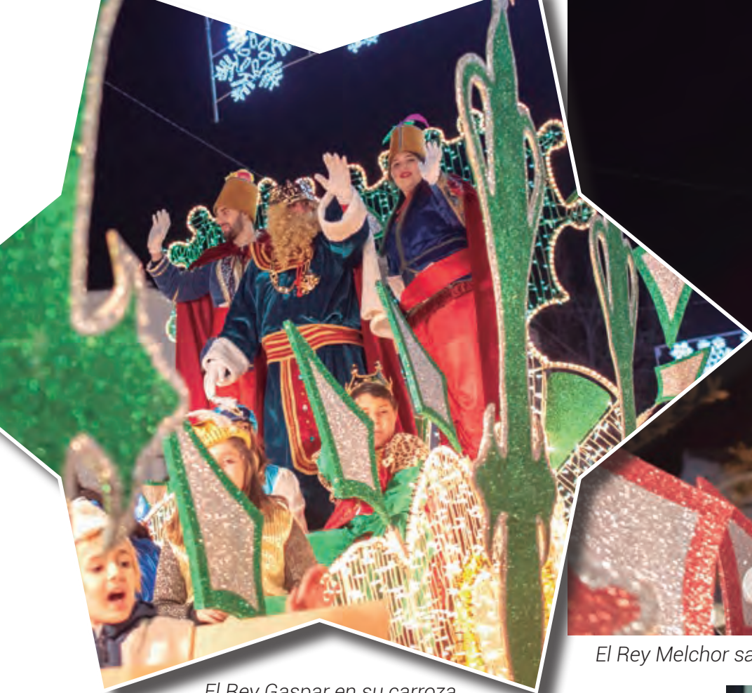
El Rey Gaspar en su carroza llegando a Majadahonda