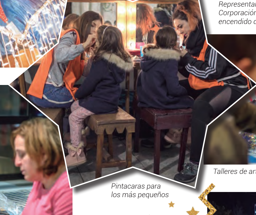
Pintacaras para los más pequeños