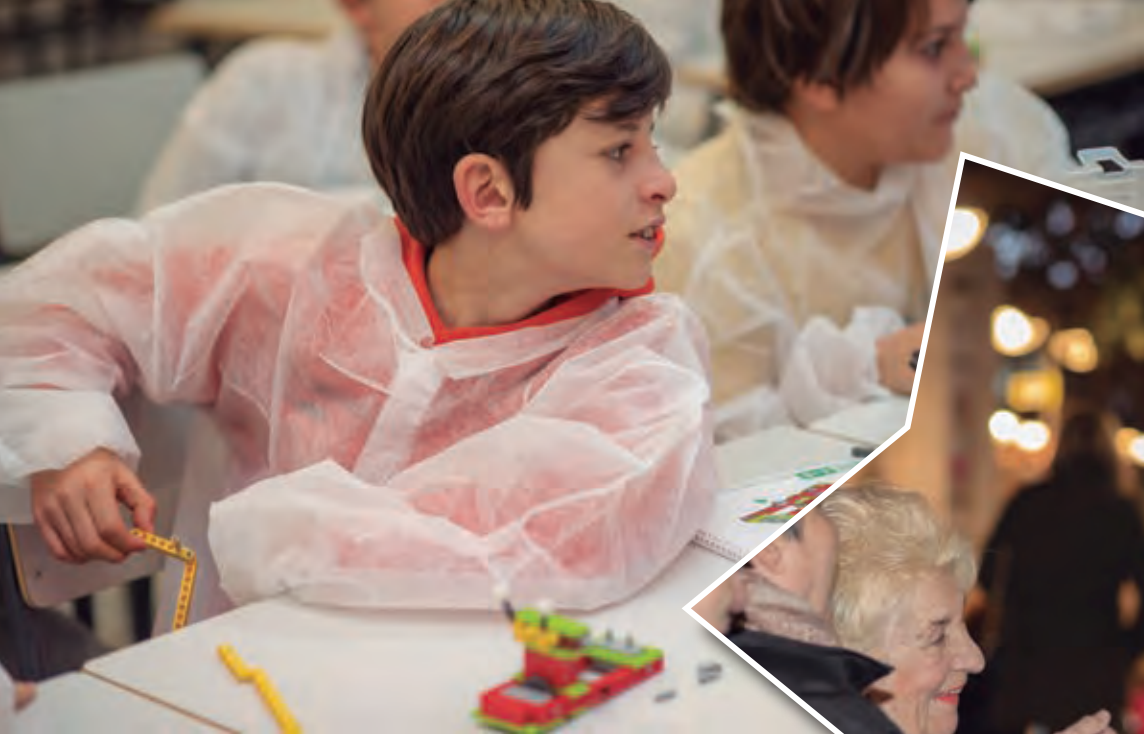
Drones y tecnología para jugar y aprender