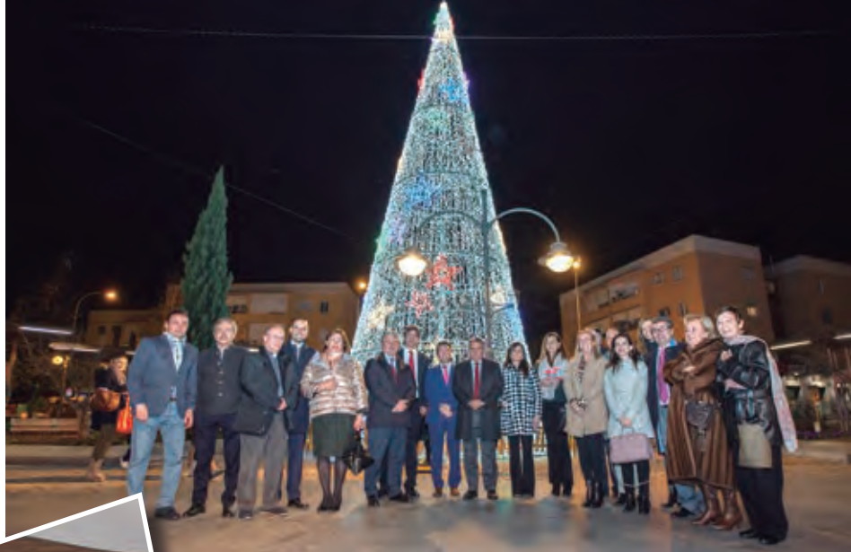
Representantes de asociaciones y Corporación Municipal acudieron al acto de encendido de las luces