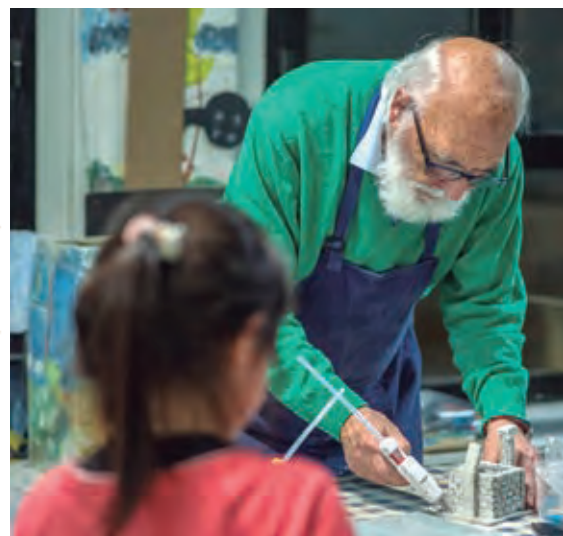
Taller de Belenismo