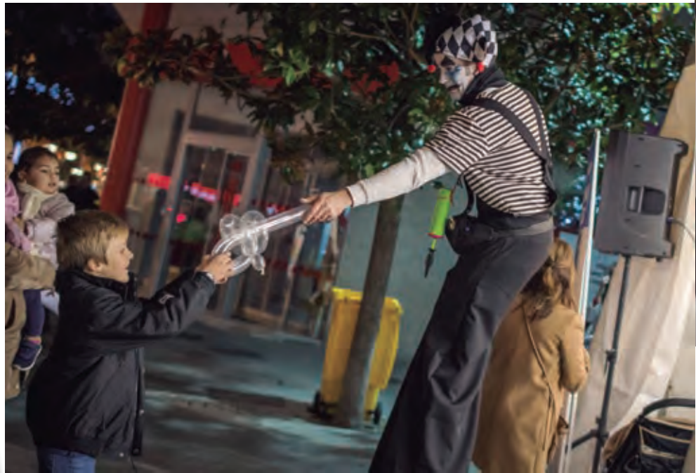
Actividades de globoflexia

Con la presentación del Premio Ciudad Europea de la Navidad 2019 y el encendido de las luces comenzó la programación navideña con actividades para todas las familias y, muy especialmente, pensadas para los más pequeños.