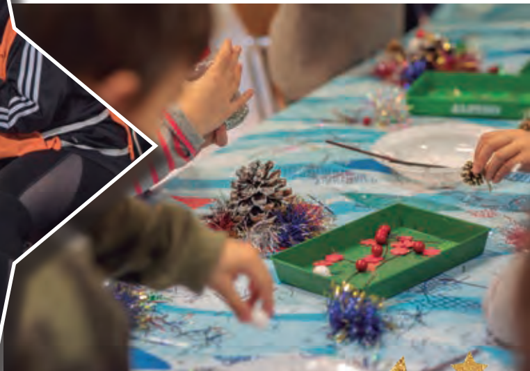
Talleres de arte para los niños