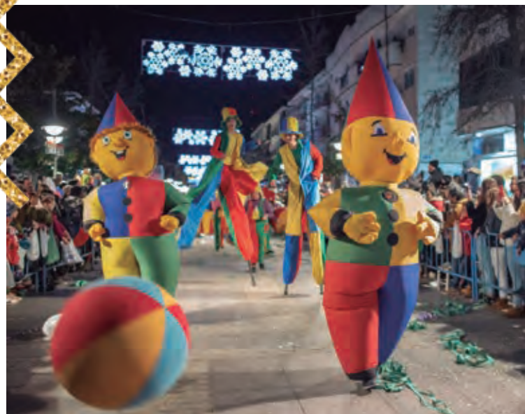
Un año más la cabalgata reunió a las familias en la Gran Vía