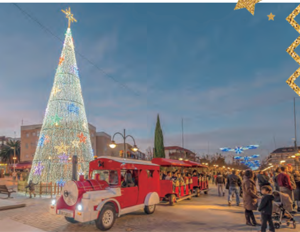
Éxito del Tren de la Navidad