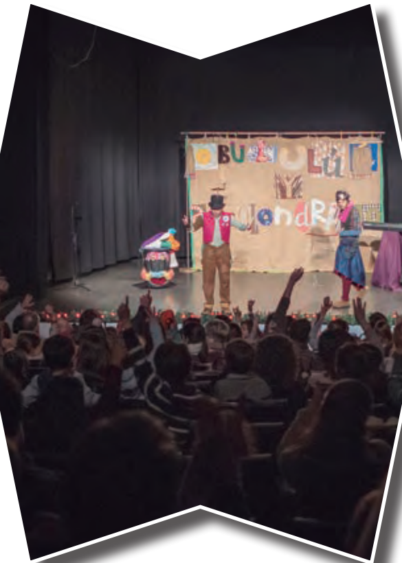
Actuaciones familiares en el Auditorio Alfredo Kraus