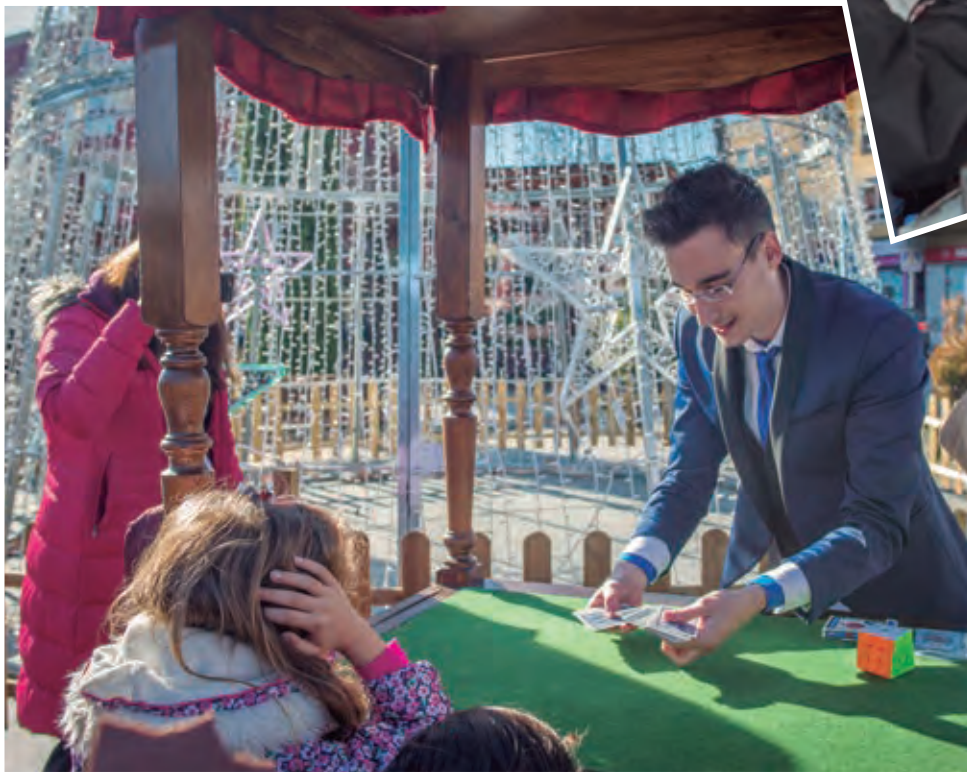
El carramato mágico