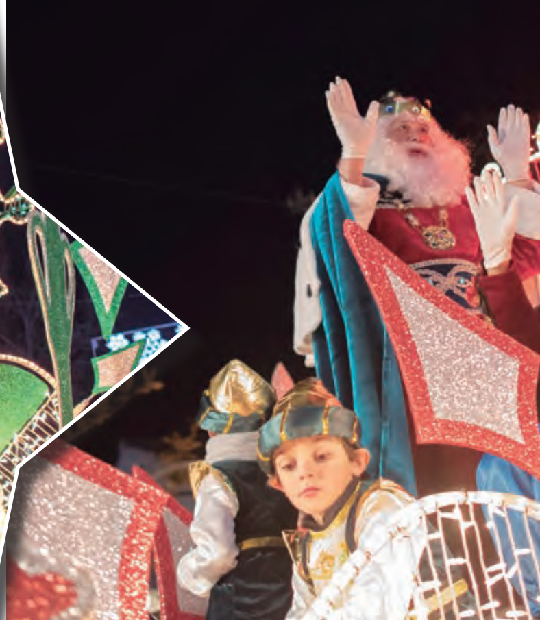
El Rey Melchor saluda a los niños de Majadahonda